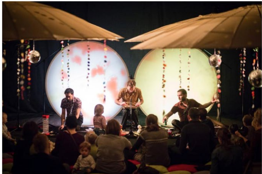
La C ie Chapi Chapo et les Petites musiques de pluie présentaient Toutouig Lala, un spectacle pour jeunes enfants (0 à 2 ans) et leurs parents.

Juste en face, c'est Chapi Chapo et les Petites musiques de pluie, du nom de la compagnie qui propose le spectacle. Trois jeunes hommes qu'on croirait perdus au milieu d'un incroyable fatras d'instruments de musique et de jouets - de la deuxième moitié du XXe siècle pour l'essentiel - plus étonnants les uns que les autres : un véritable cabinet de curiosités. Et puis les musiciens s'animent. Xylophones, mini-guitares et pianos, flûtes à coulisse, scie musicale, orgues électroniques, boîtes à musique mais aussi Dictée magique (célèbre jeu des années 1980) : mécanique et électronique se mêlent pour former de petites ritour-